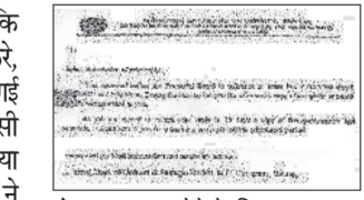
रोहतक। जवाब देने के लिए विश्वविद्यालय द्वारा छात्रों को जारी किया गया पत्र।

भी हैं। लेकिन इन्होंने मामले को लेकर अभी तक ज्यादा संवेदनशीलता नहीं दिखाई थी। शुक्रवार सुबह युनिवर्सिटी ने प्रोफेसर को फटकार लगाई तो शाम तक मामले की अंतिम फैक्ट्री थी, या नहीं। वहीं मंडू प्रधान सिवाल ने कहा कि छात्रों पर युनिवर्सिटी कार्रवाई कर रही है तो फिर विश्वविद्यालय को यह स्पष्ट करना चाहिए कि गमले वयो बनाए जा रहे थे 30 को पेरा हुए ये विद्यार्थी जिन छात्रों पर वीसी आवास परिसर में घुसने के आरोप थे, उन्हें अपना पक्ष 29 सितंबर को रखना था। इसके लिए छात्र पहुंचे भी, लेकिन छात्रों ने