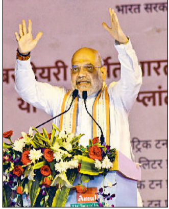
हरिभूमि न्यूज | रोहतक

वर्ष 2014 की तुलना में डेयरी क्षेत्र में विकास 86 प्रतिशत से बढ़कर 120 प्रतिशत तक पहुंचा