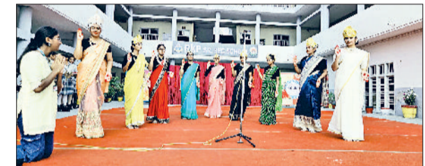
महम। नाटक का मंचन करती आरकेपी स्कूल मदीना की छात्राएं।

आरकेपी स्कूल मदीना में दशहरा का त्योहार धूमधाम से मनाया गया। इस दौरान नवरत्न, गांधी जयंती, लाल बहादुर शास्त्री जयंती पर्व भी मनाए गए। इन कार्यक्रमों का मुख्य उद्देश्य भारतीय संस्कृति, परंपरा तथा धार्मिक मूल्यों से बच्चों को जोड़ना, उनमें नैतिक आदर्शों का संचार करना रहा। विद्यार्थियों ने रावण के अहंकार तथा गाँधी जी व लाल बहादुर शास्त्री के आदर्शों पर आधारित नाटिका, नृत्य, कविता तथा भाषण प्रस्तुत कर सत्य व अहिंसा, बुराई पर अच्छाई की जीत तथा सामाजिक सद्भावना का संदेश दिया।