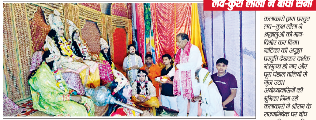
रोहतक। पुराने बस स्टैंड स्थित प्राचीन रामलीला सोसयटी के मंच पर मंचन करते कलाकार।