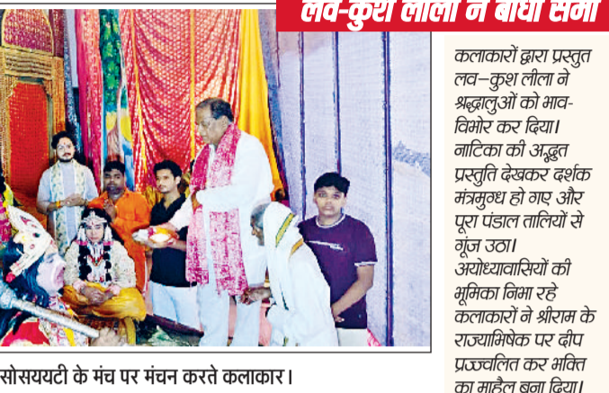
लव-कुश लीला ने बांधा सना